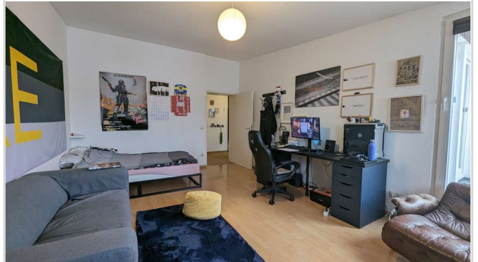
Schlafzimmer 1 (2)